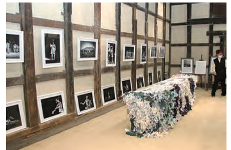
土方巽のパネル展