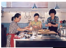
◀「かもめ食堂」

米蔵を会場としたミニシアター第1弾は「かもめ食堂」を上映しました。作品の選定には、秋田でシネマ運営を行うアウトクroppが協力。江戸時代に建てられた土蔵で観る映画、そしてスイーツのお土産などユニークな鑑賞会となりました。