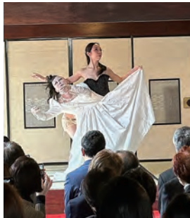
ダンスパフォーマンス

オープンを記念して開催した「ふるまい茶屋」には長い行列も。近隣の菓子舗「博進堂」「旭南高砂堂」のお菓子やとん汁、甘酒をふるまったほか、秋田県華道連盟・大和花道秋田支部による花のいけこみ披露や、NPO土方巽記念