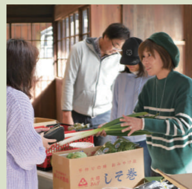
つなぐ便 (とれたて野菜)