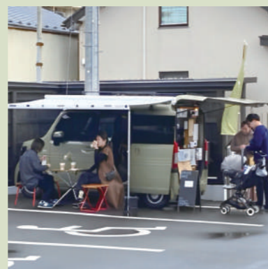
マイローストコーヒー (コーヒー)