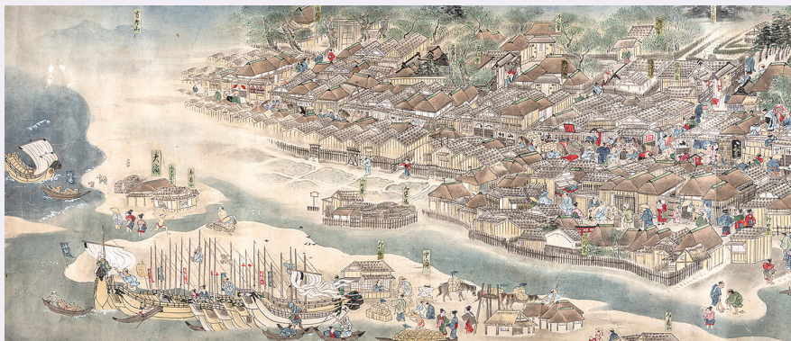
伝 荻津勝孝「秋田街道絵巻(上巻・土崎湊部分)」/秋田市立千秋美術館蔵

歴史文化ラボは、「歩く」「学ぶ」「作る」をテーマに、秋田のまちを歴史文化の視点で紐解く研究室。第2弾は、「羽州街道歴史まつり2024」に合わせて開催する民謡ライブ&トークです！生の三味線に乗せた民謡や、歴史文化が大好きな納谷さんのトークで「歴史と文化のおもしろさ」に触れてみませんか？当日は、羽州街道交流会・鑑啓記さんが選定した街道関連の書籍も展示します。