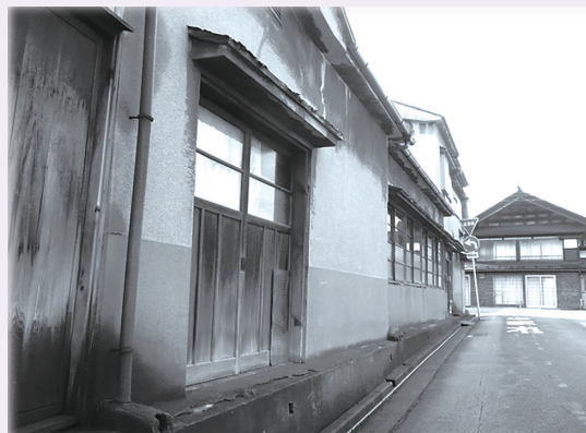
KAZUさんが撮影した、ある日の馬口労町周辺