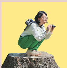
かなた 秋田市地域おこし協力隊