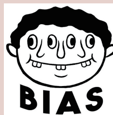
ばいあす bias イラストレーター