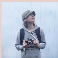
おみお omio コピーライター